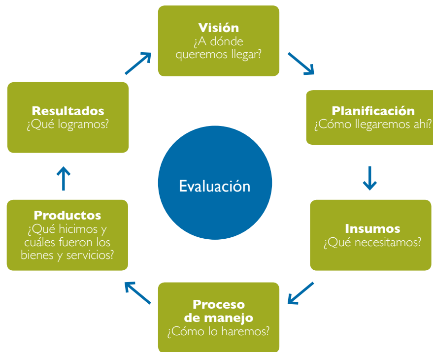
Figura 2. Ciclo de manejo propuesto por la Comisión Mundial de Áreas Protegidas de la UICN, (CMAP-UICN).

La figura 3 muestra el monitoreo de la Efectividad de Manejo dentro del contexto de la planificación del ASP.